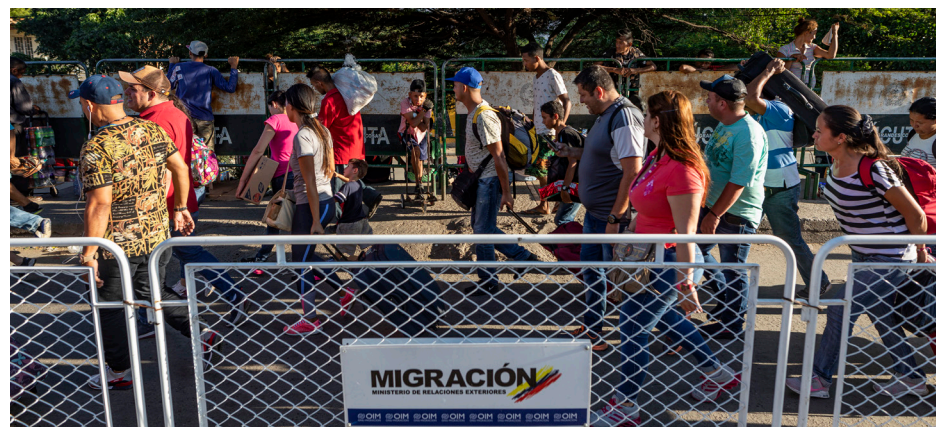
Cúcuta y Barranquilla tienen una población venezolana mayor a lo que se observa en otras ciudades.

Estos datos podrían servir de insumo para una planeación estratégica de reubicación de la población migrante donde se considere, además de los tamaños de la población, las capacidades institucionales de los entes territoriales. ✓