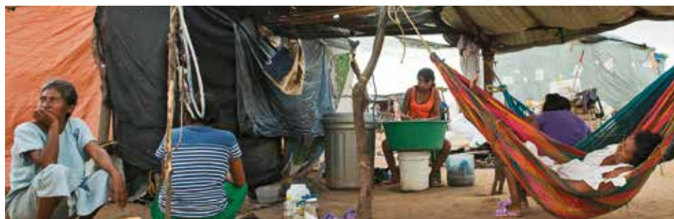
El hacinamiento y la falta de condiciones óptimas de los migrantes incrementan la tasa de pobreza multidimensional.

Por su parte, las condiciones de salud que están relacionadas con el aseguramiento y las barreras de acceso a servicios médicos, aumentaron su contribución a la pobreza multidimensional, principalmente por la privación en el aseguramiento. En 2018, el 11 % de los hogares del país tenía al menos un miembro del hogar sin afiliarse al sistema (superior en 1,4 puntos porcentuales comparado con 2016).